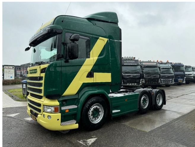
Scania R450 6X2 EURO 6 STEERING AXLE