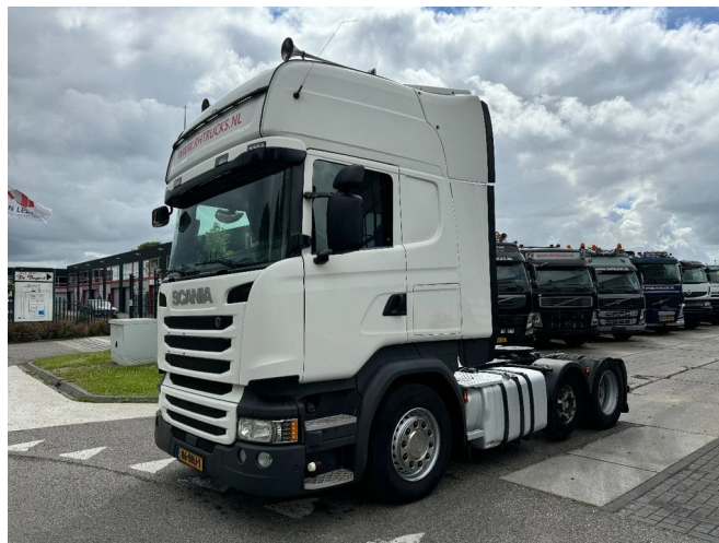
Scania R450 6X2 EURO 6 HYDRAULIC AUTOMATIC