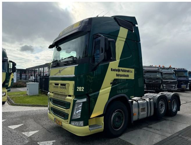
Volvo FH 460 6X2 EURO 6 STEERING AXLE I-SHIFT ECOD...