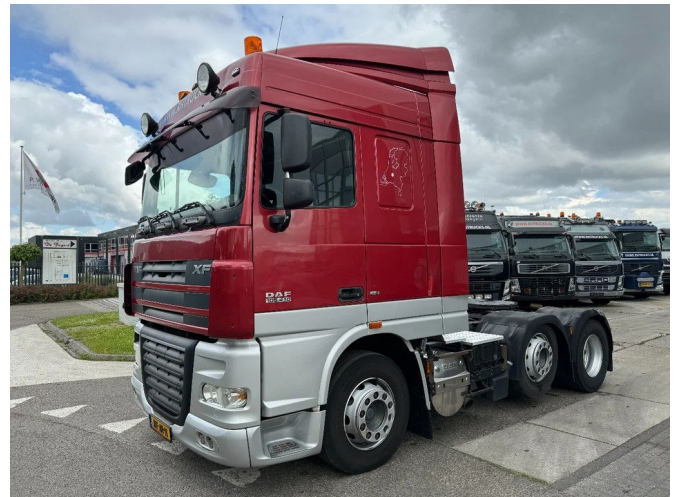
DAF XF 105.410 6X2 STEERING AXLE MANUAL EURO 5