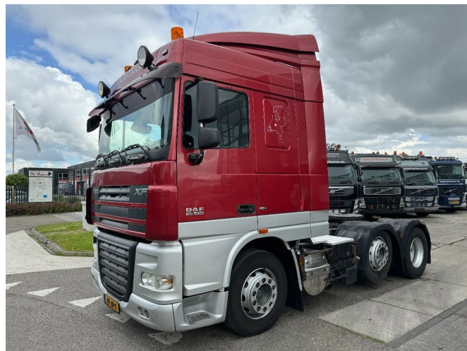
DAF XF 105.410 6X2 STEERING AXLE MANUAL EURO 5