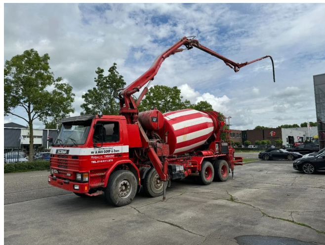
Scania P113-320 8X4 MIXER 9M3 + 24M PUMP + REMOTE...