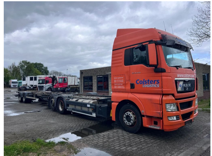
MAN TGX 26.440 XLX 6X2 + HANGER EURO 5 - BDF CHA...