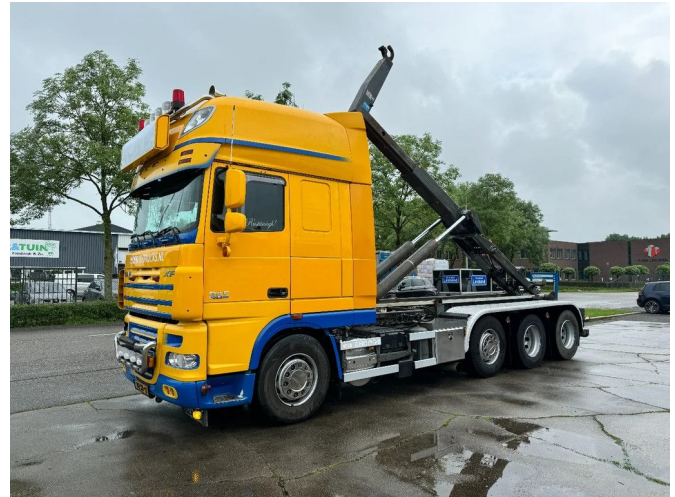
DAF XF 105.460 8X2 EURO 5 HOOKLIFT VDL 30-6500