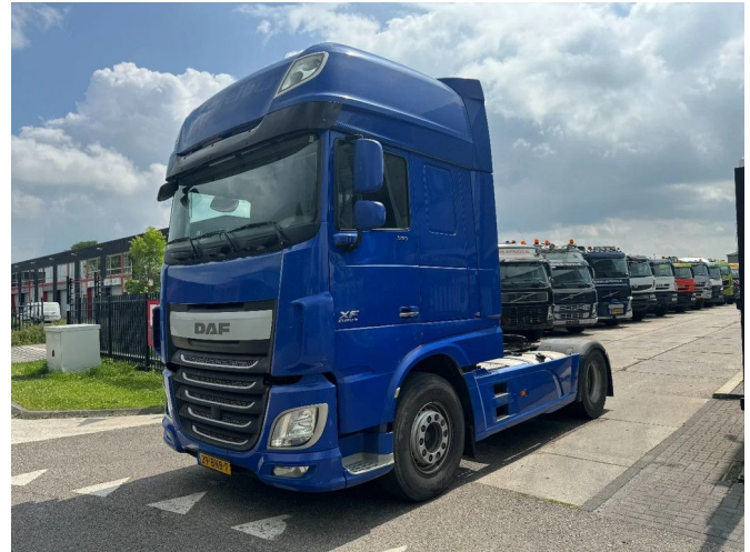
DAF XF 460 4X2 EURO 6 RETARDER SKIRTS