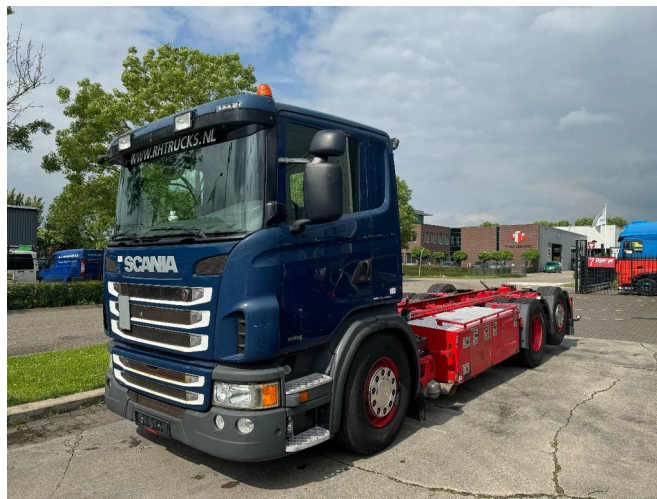
Scania G440 6X2 EURO 6 - CHASSIS + STEERING AXLE