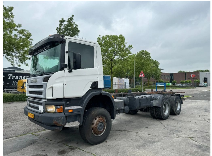
Scania P380 6X6 FULL STEEL AIRCO