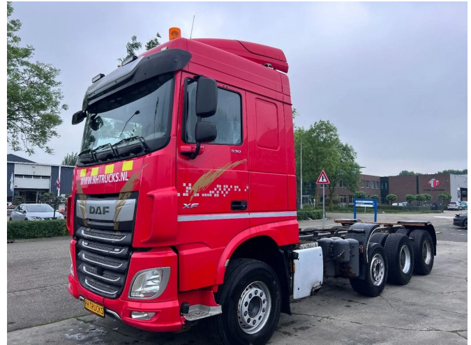
DAF XF 530 8X4 EURO 6 - FULL STEEL SUSP. - MANUAL ...