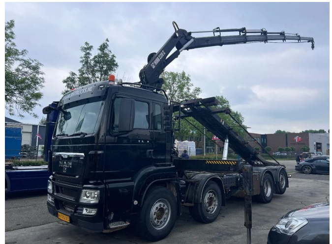
MAN TGS 35.440 8X2-4 + HIAB 220C-5 REMOTE + CABLE L...