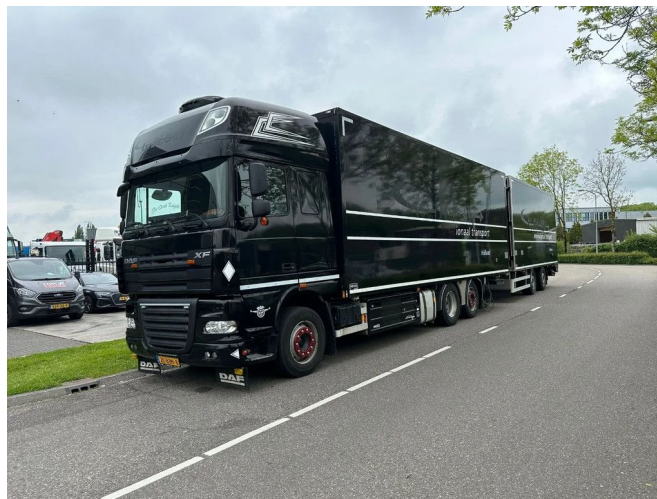
DAF XF 105.460 6X2 EURO 5 MET AANHANGER THERMOK...