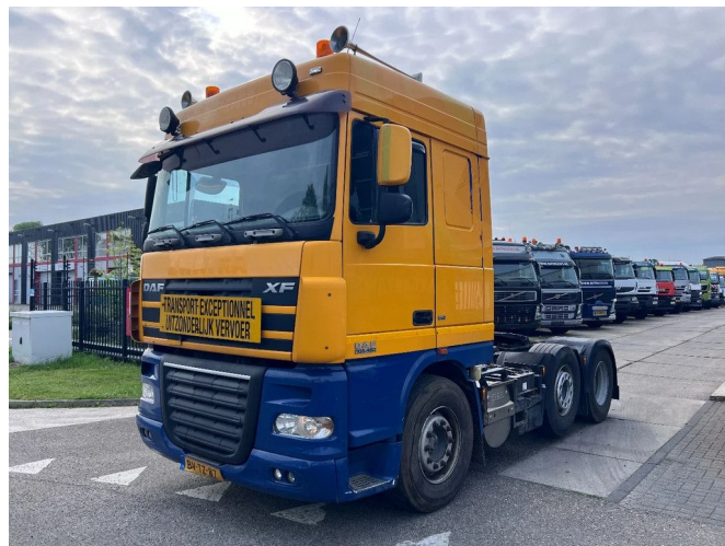
DAF XF 105.460 6X2 EURO 5 STEERING