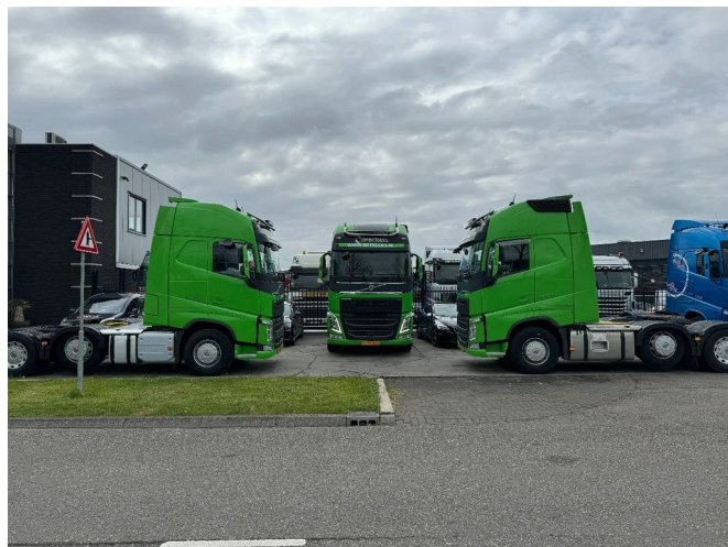
Volvo FH 460 6X2 EURO 6D + STEERING AXLE + HYDRAU...