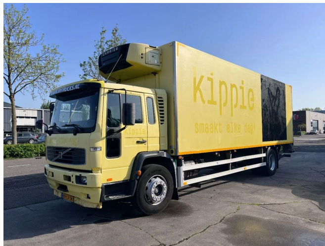
Volvo FL 619 4X2 + CARRIER SUPRA 550 + B.A.R CARGOLIFT...