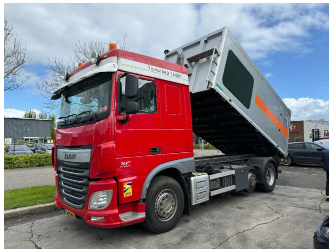
DAF XF 460 6X2 EURO 6 + BULTHUIS TIPPER