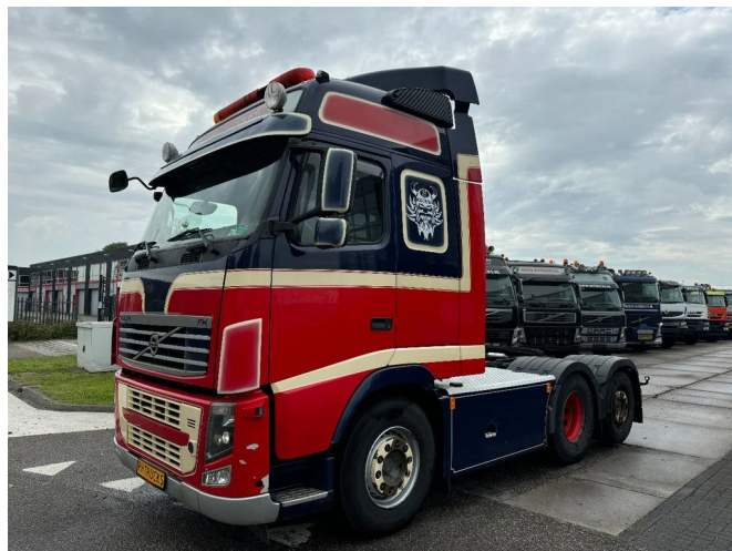
Volvo FH 500 6X2 EURO 5 + KIEPER HYDRAULIEK