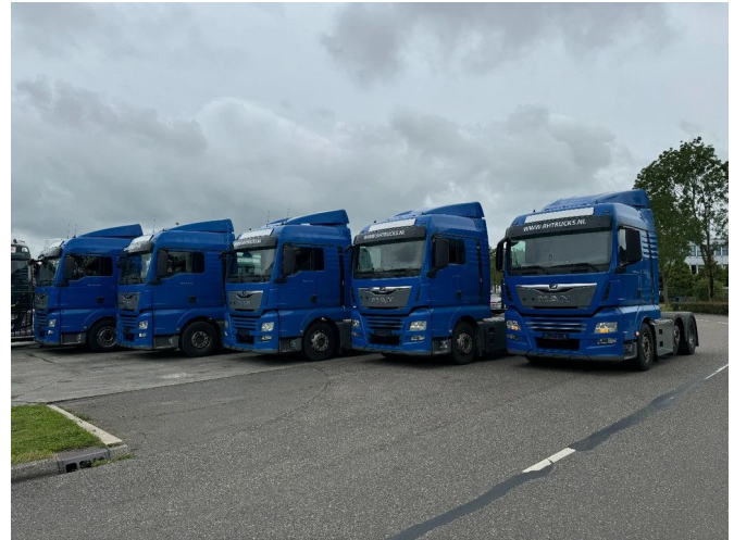
MAN TGX 26.460 XLX 6X2-2 EURO 6 LIFT AXLE