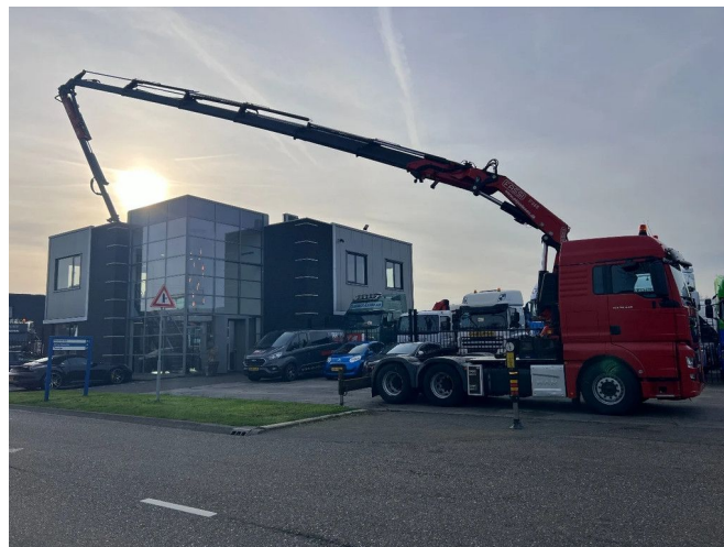
MAN TGX 28.440 XLX EURO 6 6X2 + FASSI F365 + FLYJIB ...