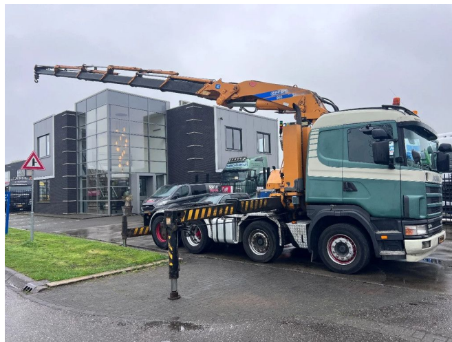
Scania R124-420 8X4 EURO 3 + EFFER 950/6S + 1 + REMOTE