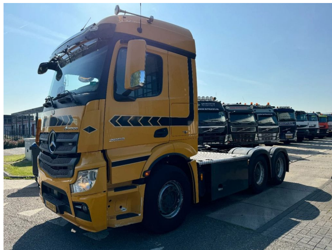
Mercedes-Benz Actros 2653 6X4 EURO 6 - BIG AXLES + HY...