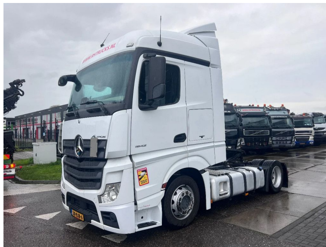
Mercedes-Benz Actros 1842 MEGA + HEFSCHOTEL + ... 4x2 Referentienummer: MB117319