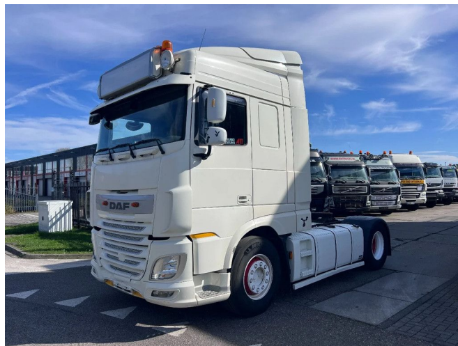
DAF XF 460 EURO 6 RETARDER