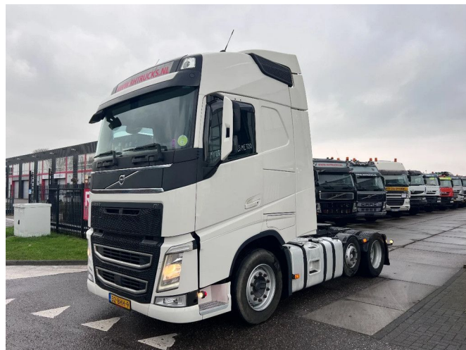
Volvo FH 460 6X2 EURO 6 i-Shift + i-ParkCool + TIPPER HY...