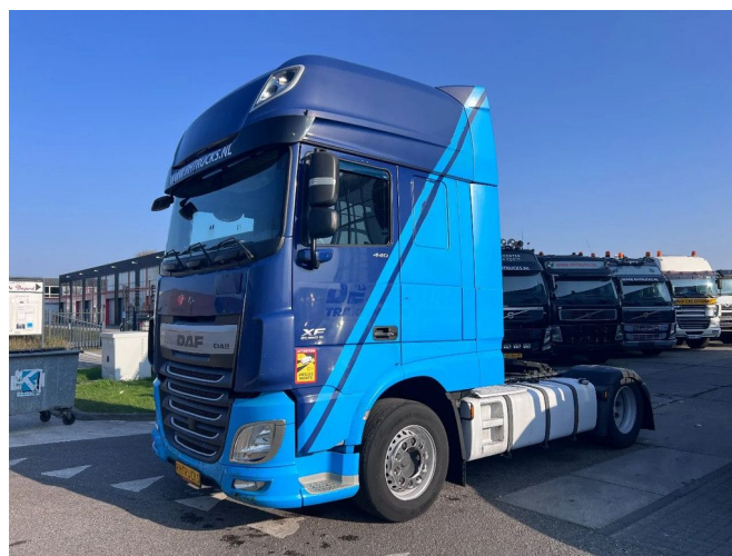
DAF XF 440 SSC 4X2 EURO 6