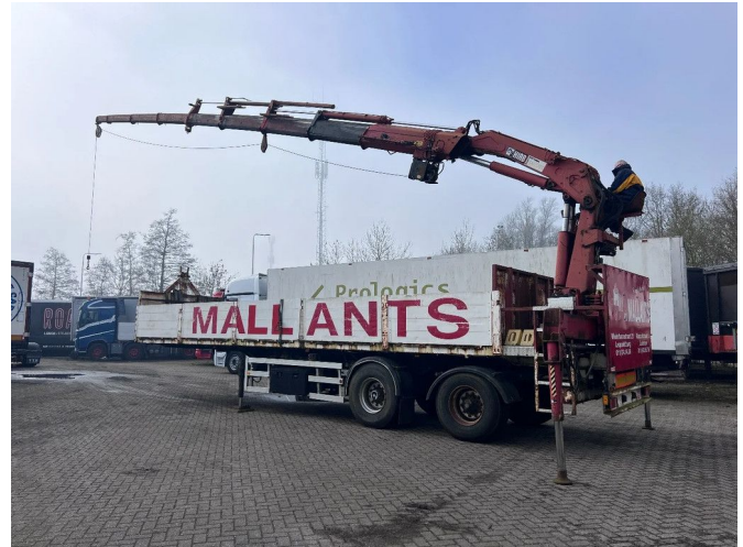
ATM 2 AS + HIAB 300-4 + WINCH