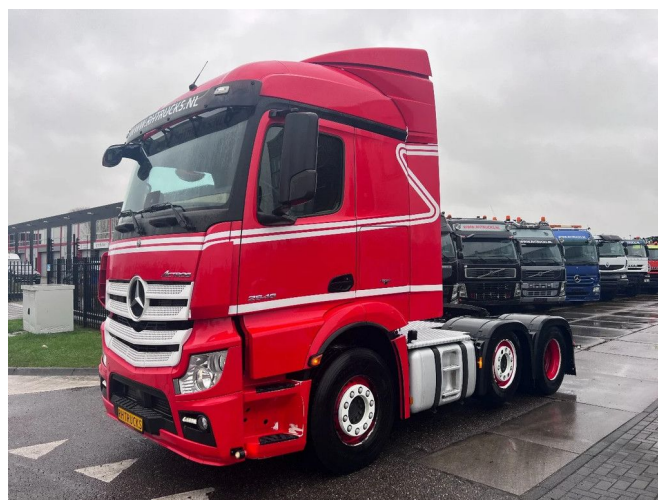
Mercedes-Benz Actros 2546 6X2 EURO 6 LIFT AXLE