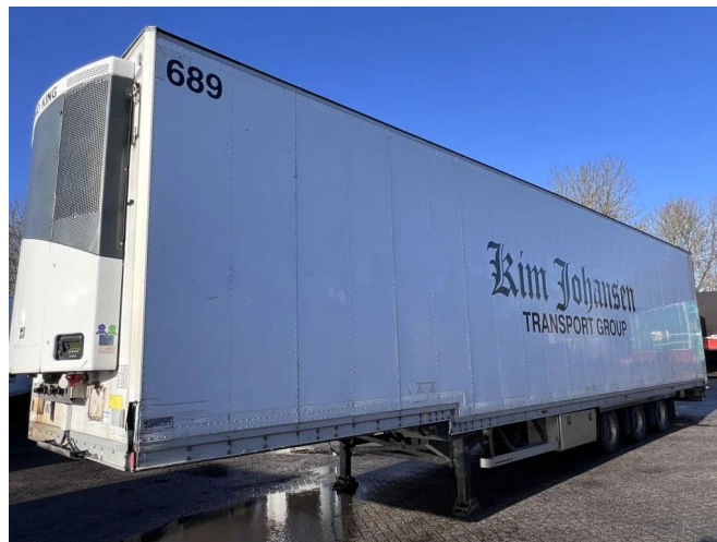
Talson F1227 + THERMO KING + ROLLENBANEN - MEGA