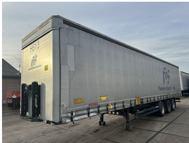
Kögel 4 UNITS - S24 3xBPW 1362x248x275 LxBxH