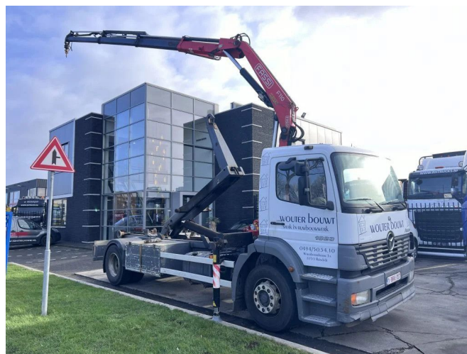
Mercedes-Benz LS 1923 ATEGO + 2011 FASSI F110 + ... 4x2