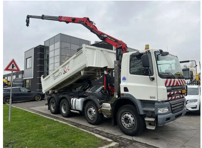
DAF CF 85.410 8X4 + EPSILON Q150Z + REMOTE - FULL ...