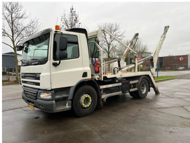
DAF CF 75.310 4X2 EURO 5 MANUAL + 14 TONNES VDL