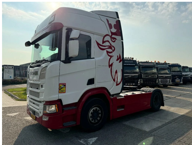
Scania R520 V8 NGS RETARDER SKIRTS DOUBLE T... 4x2