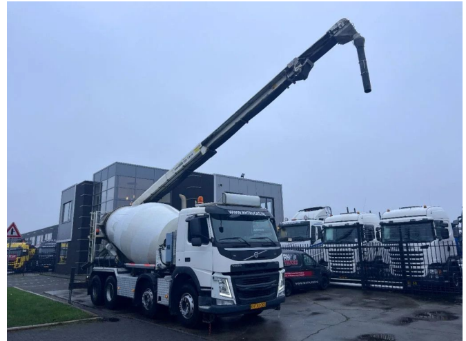
Volvo FM 410 8X4 MIXER 9m3 + LIEBHERR CONVEYOR BELT