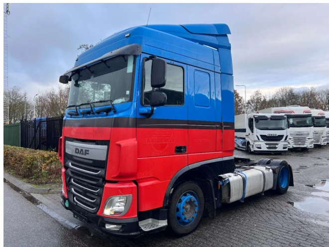
DAF XF 440 SC 4X2 MEGA 738.460km