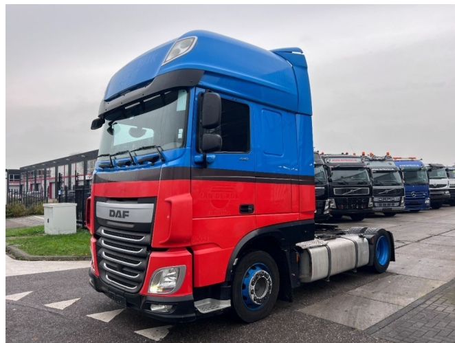
DAF XF 440 4X2 MEGA 678.649km