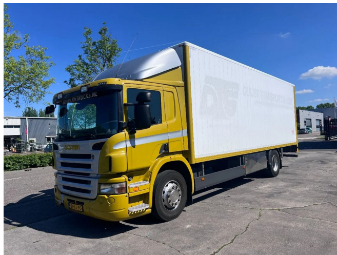
Scania P230 4X2 EURO 5 BOX 790x246x252