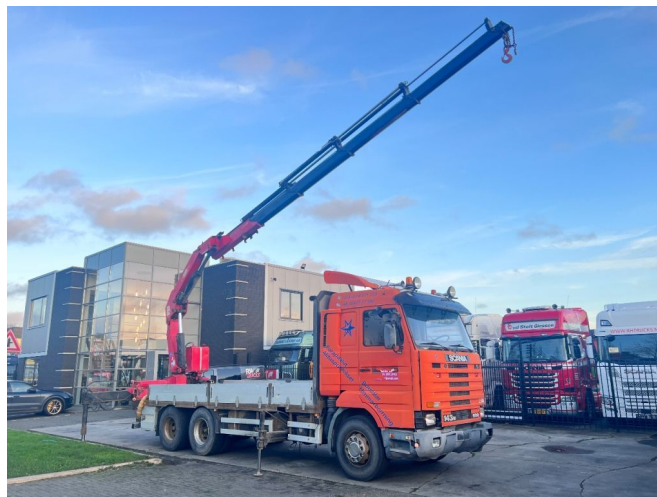
Scania R143-500 V8 6X4 + PM 32024 CRANE Bj 2000 - MA...