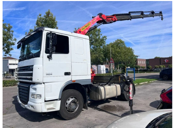
DAF XF 105.410 4X2 EURO 5 MANUAL + PALFINGER PK16...