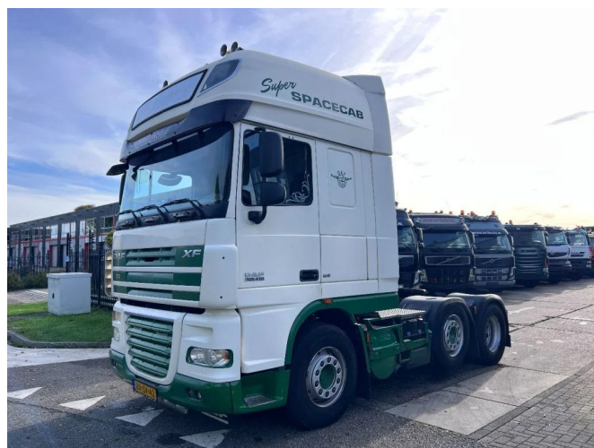
DAF XF 105.460 SSC 6X2 EURO 5 MANUAL GEARBOX