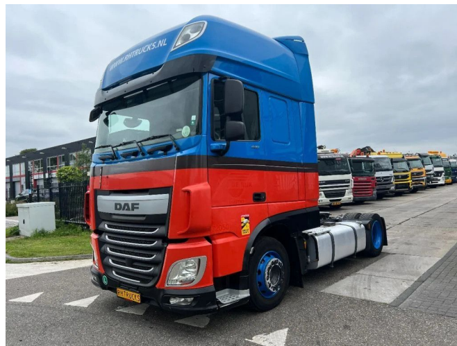
DAF XF 440 4X2 - EURO 6 - MEGA