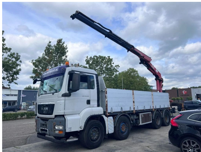
MAN TGS 35.440 8X4 + HMF 2220 K2 MET REMOTE