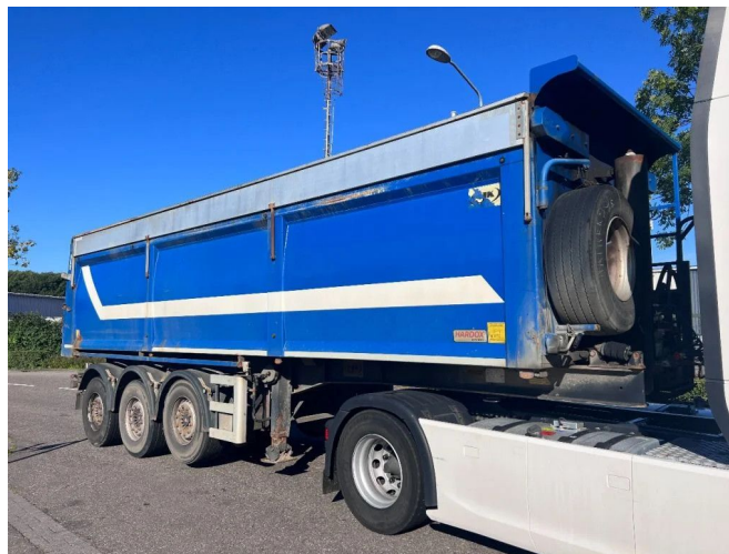
AJK OP 17-27/22 5