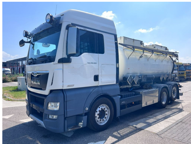
MAN TGX 26.560 6X2 EURO 6 - 11.500L VACUUM CLEANER... Referentienummer: MA212542