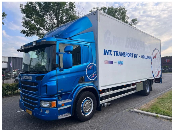
Scania P250 4X2 EURO 6 - 20 TON - BOX 7,75 METER + D...