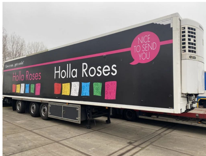
H.T.F. THERMO KING SPECTRUM