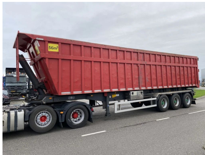
VAN HOOL 3C1017 - TIPPER - 56 M3 - STAHL/STEEL - 3 AX...