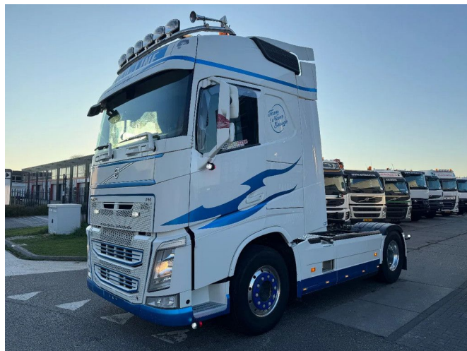
Volvo FH 460 4X2 EURO 6 SKIRTS ALCOA HYDRAULIC